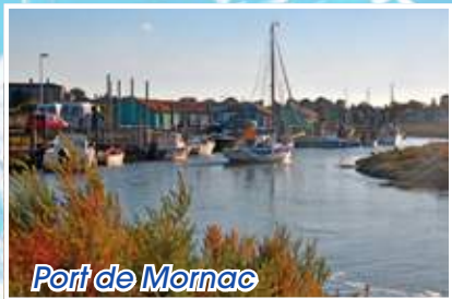
Port de Mornac

Nature, espace, sport et détente dans une zone classée et protégée avec des plages surveillées