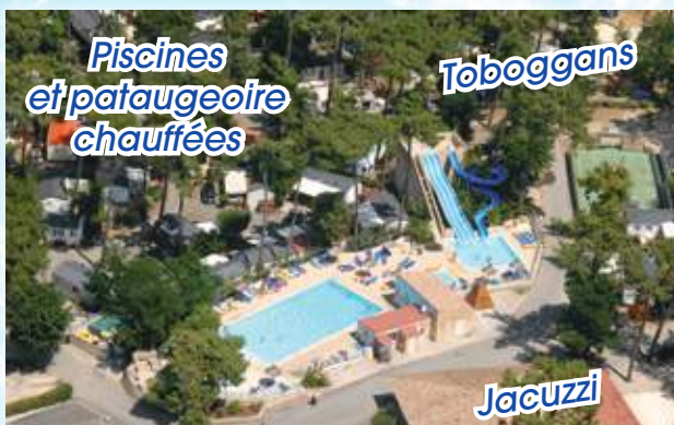
Piscines et pataugeoire chauffées