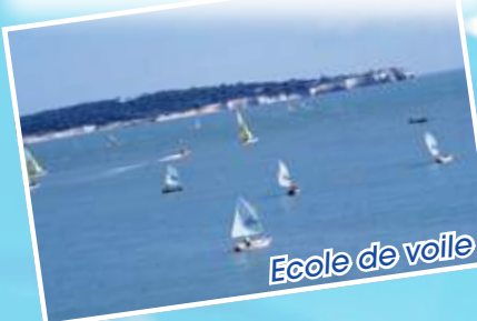
Ecole de voile

à proximité : Parc de l'Estuaire site classé Pistes V.T.T., pistes cyclables, pistes rollers, parcours sportif, équitation en forêt