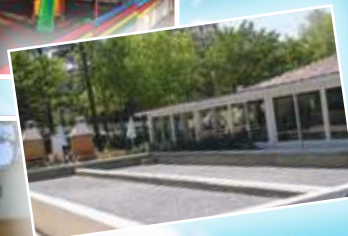
Un cadre agréable et ombragé