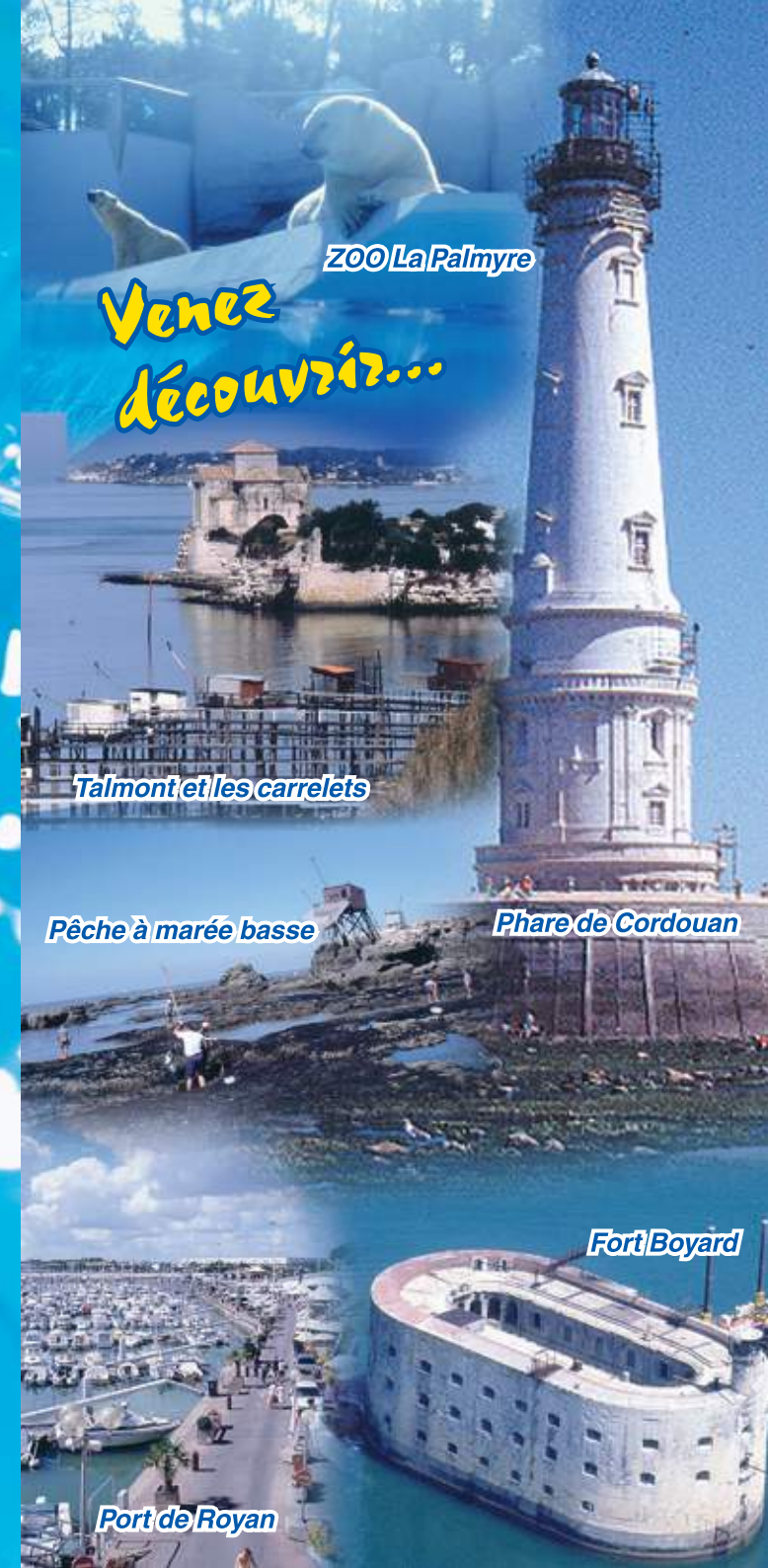
ZOO La Palmyre